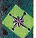
Planche 6 / 9