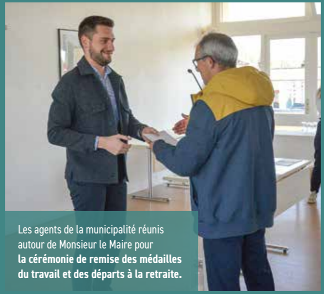
Les agents de la municipalité réunis autour de Monsieur le Maire pour la cérémonie de remise des médailles du travail et des départs à la retraite.