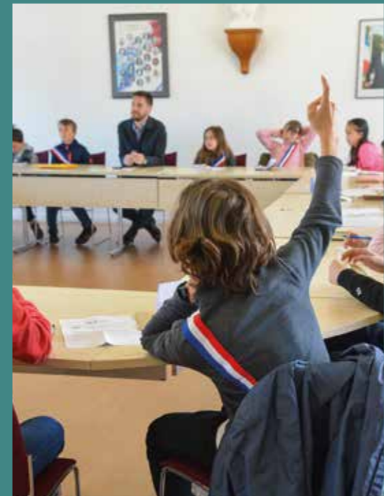
Le Conseil Municipal des Jeunes s'est réuni le 2 avril pour aborder des projets sur la culture, le sport, l'environnement, la citoyenneté et le lien intergénérationnel.