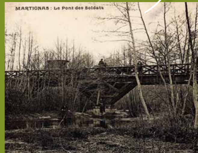
Le pont des soldats, servant au passage de véhicules sur la Jalle pour aller de Souge à la poudrière, début du XX e siècle.