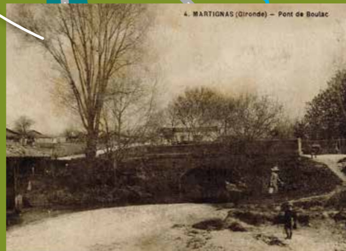
Le pont de Boulac : pont et son lavoir sur la Jalle, début XX e siècle.

L'existence de ponts à Martignas est mentionnée dès le XVII e siècle. Le « pont du Pas » sur le chemin du Pas long, le « pont de Boulac » ou « pont de la Berlotte » permettaient le franchissement de la Jalle entre Bordeaux et l'océan. Le « pont du soldat » fut construit au début du XX e siècle pour faciliter la circulation des véhicules militaires entre le camp de Souge et la poudrière de Saint-Médard-en-Jalles. Plus récemment, d'autres ponts ont été construits pour le plaisir des promeneurs.