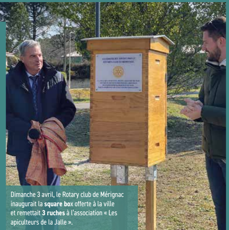
Dimanche 3 avril, le Rotary club de Mérignac inaugurerait la square box offerte à la ville et remettait 3 ruches à l'association « Les apiculteurs de la Jalle ».