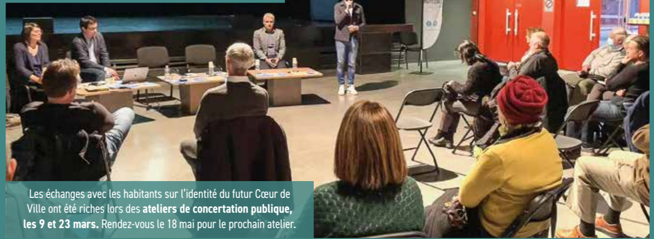
Les échanges avec les habitants sur l'identité du futur Cœur de Ville ont été riches lors des ateliers de concertation publique, les 9 et 23 mars. Rendez-vous le 18 mai pour le prochain atelier.