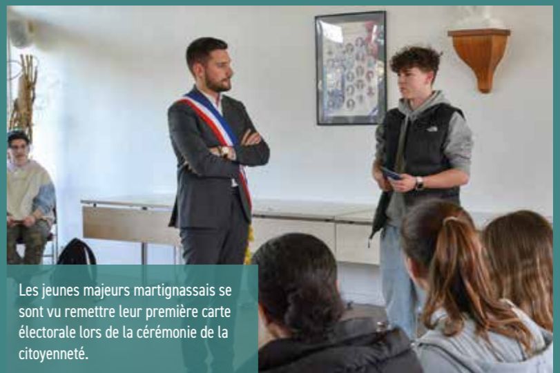
Les jeunes majeurs martignassais se sont vu remettre leur première carte électorale lors de la cérémonie de la citoyenneté.