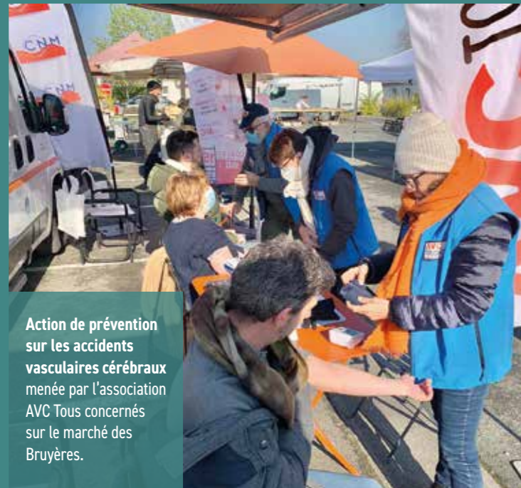
Action de prévention sur les accidents vasculaires cérébraux menée par l'association AVC Tous concernés sur le marché des Bruyères.