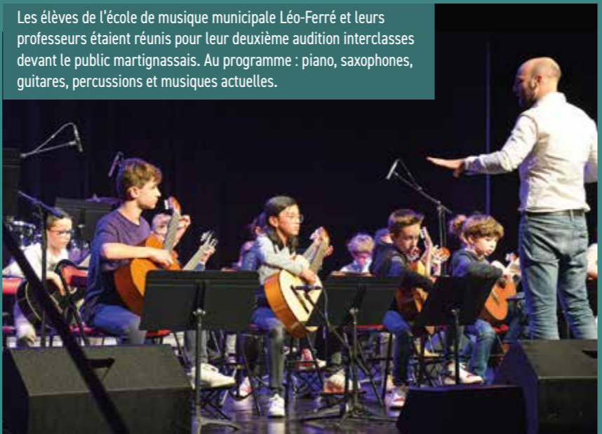
Les élèves de l'école de musique municipale Léo-Ferré et leurs professeurs étaient réunis pour leur deuxième audition interclasses devant le public martignassais. Au programme : piano, saxophones, guitares, percussions et musiques actuelles.