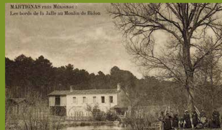
Le Moulin Bidon, une maison à étage en pierre de taille (col. Archives communales).

Véritables poumons verts de la commune, la plaine Colette-Besson et le parc Moulin-Bidon hébergeront un vaste espace privilégié de 22 ha dotés d'équipements sportifs et culturels. Une étude d'aménagement est actuellement en cours.