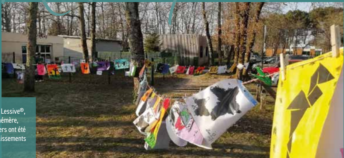
À l'occasion de la Grande Lessive®, événement artistique éphémère, les réalisations des écoliers ont été "étendues" dans les établissements scolaires de la ville.