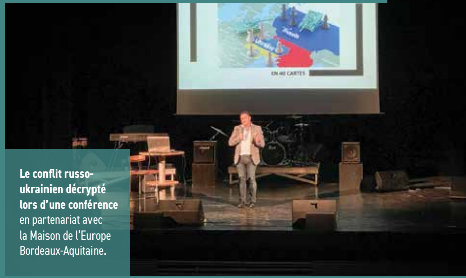
Le conflit russo-ukrainien décrypté lors d'une conférence en partenariat avec la Maison de l'Europe Bordeaux-Aquitaine.